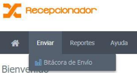
Figura 3. Menú, bitácora de envío

En la bitácora de envío, Figura 4, es posible hacer búsquedas simples en cualquiera de las columnas utilizando el cuadro de búsqueda. Si el usuario necesita una búsqueda avanzada es necesario utilizar la función Reportes -> Ventas .