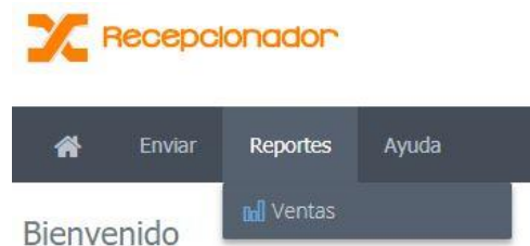
Figura 5. Menú, reporte de ventas

Para ingresar al reporte de ventas, es necesario dar clic en el menú Reportes y seleccionar la opción Ventas (Figura 5). A diferencia de la bitácora de envío, el reporte de ventas permite utilizar filtros para delimitar la búsqueda de comprobantes (Figura 6). Adicionalmente, es posible exportar los resultados a un archivo de texto separado por comas (.csv) para poder manipularlo con cualquier programa de hojas de cálculo (Microsoft Excel®, Apache OpenOffice Calc® u otro) dando clic en el botón BUSCAR Y GENERAR EXCEL .