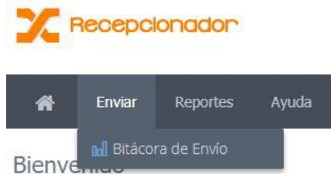
Figura 3. Menú, bitácora de envío

En la bitácora de envío, Figura 4, es posible hacer búsquedas simples en cualquiera de las columnas utilizando el cuadro de búsqueda. Si el usuario necesita una búsqueda avanzada es necesario utilizar la función Reportes -> Ventas .