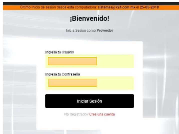
Figura 1. Inicio de sesión

Posteriormente seleccionar el perfil de PROVEEDOR , ingresar usuario y contraseña , como muestra la Figura 1, y dar clic en el botón Iniciar Sesión .