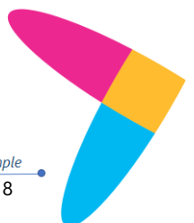
Figura 7. Reporte de comprobantes